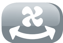
Oscillation de flux d'air