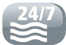
Possibilité de drainage permanent