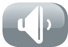
Faible niveau sonore