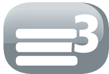
3 couches de filtre