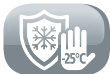
Protection antigel de l'unité extérieure