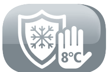
Fonction hors gel