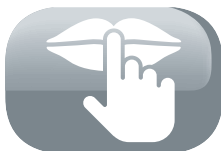
Fonctionnement grand silence