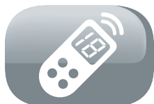
Télécommande avec écran de contrôle LCD